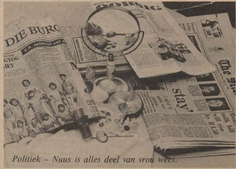
Politiek - Nuus is alles deel van vrou wees.