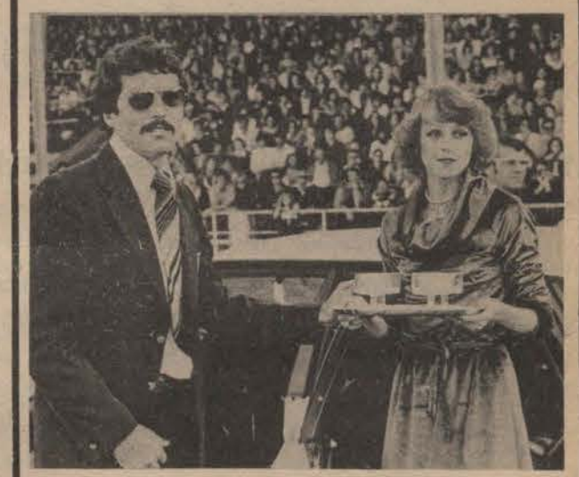
Sjampanje vóór die slagting

dekking in die VSA is kort en net op feite gerig.